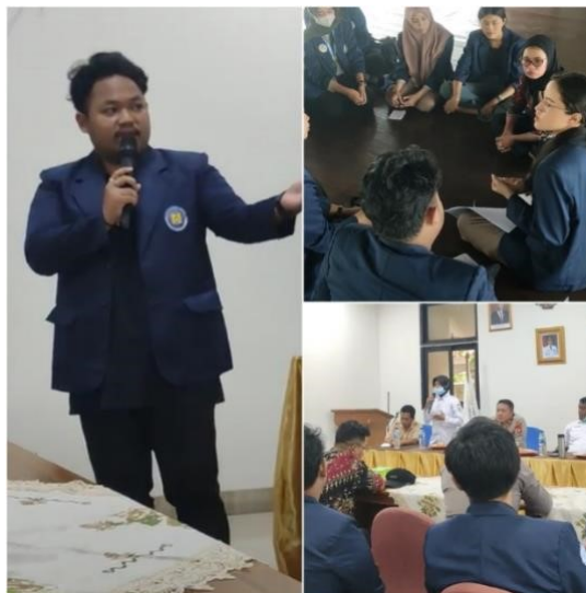
Gambar 6: Pertemuan Dengan Pihak Pemerintah Pulau Harapan

Dari program dan kegiatan yang dilakukan oleh mahasiswa Universitas Budi Luhur mendapatkan respon positif dari seluruh masyarakat Pulau Harapan, serta melihat antusias dari anak-anak setelah mengetahui jika daerah mereka memiliki taman baca dengan buku-buku yang menarik dan mereka juga memiliki rasa semangat yang tinggi saat belajar mengajar tentang bahasa Inggris. Setiap harinya, Pojok Baca selalu didatangi oleh anak-anak yang ditemani dengan orang tuanya untuk membaca buku-buku yang ada di Gazebo Pojok Baca. Dari hal tersebut dapat dikatakan jika program ini sangat menjadi hal yang positif untuk masyarakat di daerah pulau harapan.