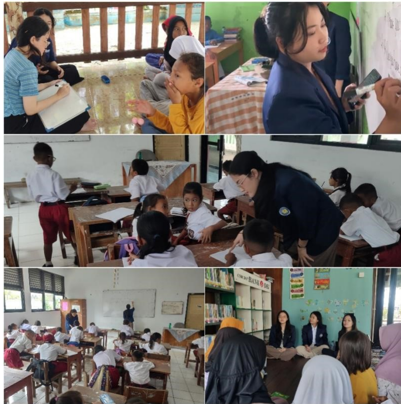
Gambar 5: Kegiatan Mengajar di Pulau Harapan

Dari program dan kegiatan yang dilakukan oleh mahasiswa Universitas Budi Luhur mendapatkan respon positif dari seluruh masyarakat Pulau Harapan, serta melihat antusias dari anak-anak setelah mengetahui jika daerah mereka memiliki taman baca dengan buku-buku yang menarik dan mereka juga memiliki rasa semangat yang tinggi saat belajar mengajar tentang bahasa Inggris. Setiap harinya, Pojok Baca selalu didatangi oleh anak-anak yang ditemani dengan orang tuanya untuk membaca buku-buku yang ada di Gazebo Pojok Baca. Dari hal tersebut dapat dikatakan jika program ini sangat menjadi hal yang positif untuk masyarakat di daerah pulau harapan.