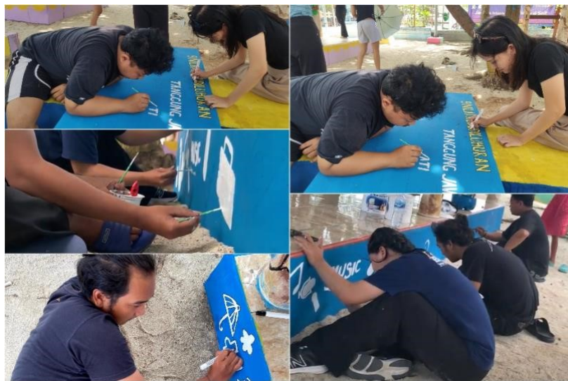
Gambar 2: Proses Pengerjaan Pojok Baca

Dari kegiatan KKN ini memiliki tujuan yang dicapai yaitu meningkatkan literasi masyarakat serta memahami bahasa Inggris guna untuk mewujudkan sumber daya manusia yang lebih berkualitas, dikarenakan Pulau Harapan adalah sebagai salah satu pulau destinasi wisata yang berada di daerah Jakarta sehingga SDM yang ada dapat menggerakkan wisatawan asing semakin banyak dan tertarik untuk datang ke Pulau Harapan. Dalam halnya mahasiswa Universitas Budi Luhur membangun sebuah taman baca yang dibentuk pada salah satu RPTRA di Pulau Harapan dengan diberi nama “Pojok Baca” untuk memberikan kenyamanan anak-anak dalam membaca serta membuat mindset jika membaca adalah hal yang menyenangkan dengan membuat tempat yang nyaman dengan banyak buku-buku yang bervariasi.