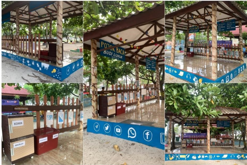
Gambar 3: Hasil Program Pembuatan Pojok Baca