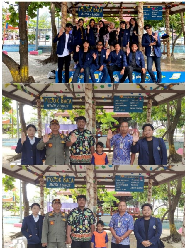
Gambar 4: Pengesahan Pojok Baca

Selama melakukan kegiatan dalam membuat pojok baca, kegiatan yang dilakukan adalah mengajar bahasa Inggris di SDN Pulau Harapan 01 Pagi dan MTsN 26 Kampus C, Kepulauan Seribu. Hal tersebut dilakukan dengan maksud meningkatkan pengetahuan selain bahasa Indonesia yaitu bahasa Inggris, guna untuk menjadikan Pulau Harapan sebagai salah satu destinasi wisata yang akan sering dikunjungi oleh wisatawan. Dari kegiatan mengajar, masyarakat dapat lebih mengetahui wawasan baru mengenai bahasa dan menambah pengetahuan anak-anak pulau tentang bahasa Inggris yang akan membantu keseharian saat menghadapi wisata asing. Selain mengajarkan bahasa Inggris di kedua sekolah tersebut, mahasiswa juga melakukan promosi Pojok Baca sekaligus mengajak siswa/i untuk membaca.