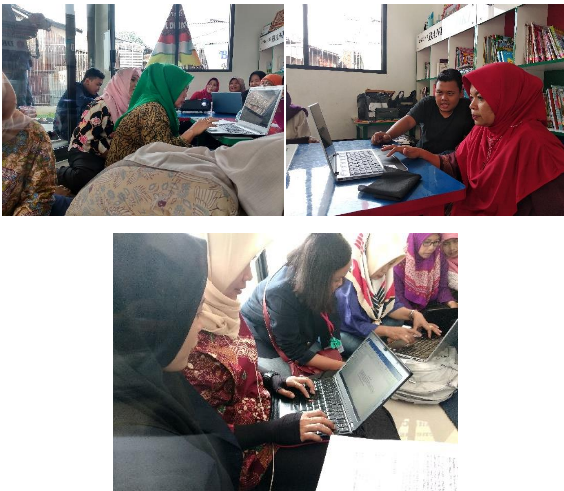
Gambar 2. Dokumentasi Kegiatan Pelatihan Penggunaan Microsoft Excel dan Microsoft Word untuk Peningkatan Kapabilitas Penggunaan Aplikasi Komputer Microsoft Office Bagi Kader PKK di RW.02 Kelurahan Cipulir.

Kegiatan pelatihan dilakukan secara personal kepada masing-masing peserta didampingi oleh pelatih agar tiap peserta dapat memahami materi yang diberikan dengan baik, setelah diberikan