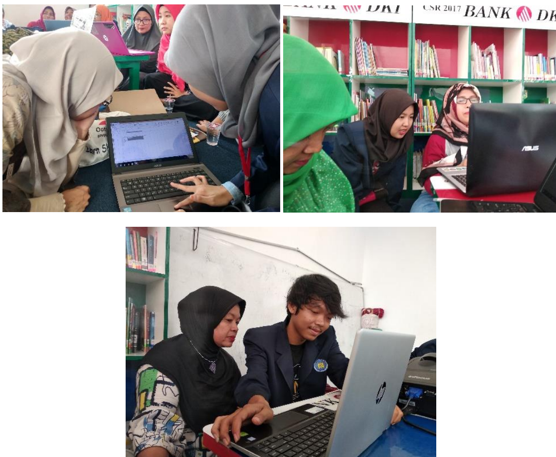
Gambar 2. Dokumentasi Kegiatan Pelatihan Pemanfaatan Internet Bagi Kader Pemberdayaan Dan Kesejahteraan Keluarga (PKK) di RW.02 Kelurahan Cipulir.

Semua kegiatan PPM berlokasi di ruangan perpustakaan RPTRA Mangga Ulir yang berlokasi di kelurahan Cipulir tepatnya di RW.02. Pada Gambar 2 ditampilkan dokumentasi dari kegiatan pelatihan