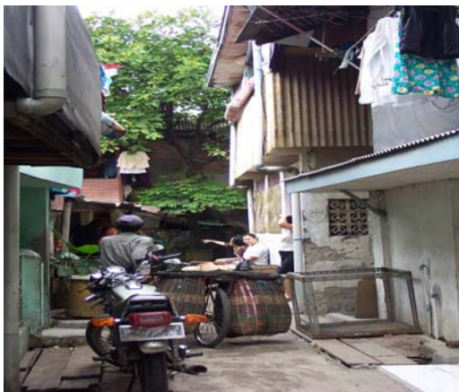
Gambar 6. Jalan Untuk bersosialisasi dan berjualan