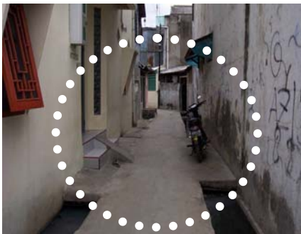
Pic. 9. Saluran drainase ditutup untuk parkir kendaraan dan perluasan sisi rumah