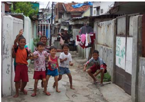
Gambar . 5. Jalan Tempat anak-anak bermain