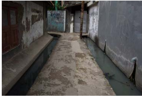
Gambar 10. Saluran drainase menggenang dan tersumbat. Kualitas air sangat buruk dan menimbulkan bibit penyakit.

Sistem drainase yang tertutup banyak terdapat di ruang-ruang yang digunakan sebagai ruang publik, seperti tempat ronda dan didepan warung sayur/ warung kelontong. Saluran yang tertutup ini, membuat jalan menjadi lebih lebar dan bersih karena tidak terlihat genangan air yang menghitam seperti di saluran yang terbuka.