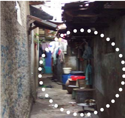
Pic. 8. Perlengkapan mencuci baju diluar rumah, air buangan langsung dibuang ke got/ saluran drainage kampung