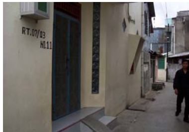
Gambar 1. Tembok bata seluruh bangunan