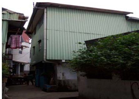
Gambar . 2. Bata separuh badan di lantai bawah dan seng di lantai atas