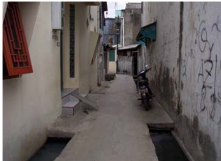
Gambar . 4. Jalan kampung

Ibu-ibu pada waktu belanja, menggunakan tempat ini untuk berkumpul dan berdialog. Anak-anak kecil menggunakan tempat ini untuk bermain-main di luar rumah. Sementara para pemuda tanggung, nongkrong di bibir jalan atau di pagar rumah sambil ngobrol-ngobrol. Di tempat ini terjadi kegiatan publik yang wadahnya sukar ditemui di wilayah dengan lahan yang sangat padat ini.