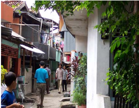
Gambar . 3. Bata separuh badan di lantai bawah dan triplek/kayu di lantai atas