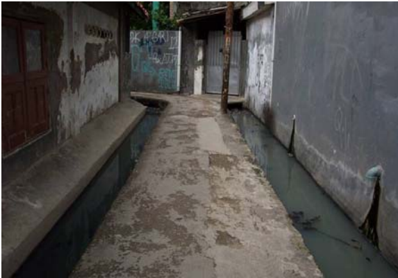
Gambar 7. Jalan telah mengalami perbaikan model MHT

Secara keseluruhan kondisi jalan masih baik, hanya saluran buangnya sudah banyak yang tersumbat dan tidak mengalir dengan lancar.